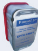
FILTROS DE COMBUSTIBLE